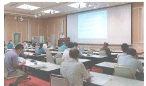
(会場)：横浜市「かながわ労働プラザ」

※第2型（通信制）研修・講習は、3年3月12日(金)がレポート提出締切日です。新型コロナウイルス感染症の感染拡大防止のため、第2型（通信制）の受講をお勧めしています。