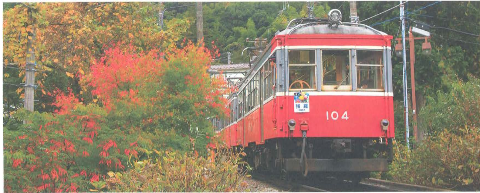
(写真：秋の箱根登山鉄道)