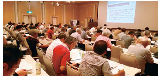
（会場：横浜市「かながわ労働プラザ」）